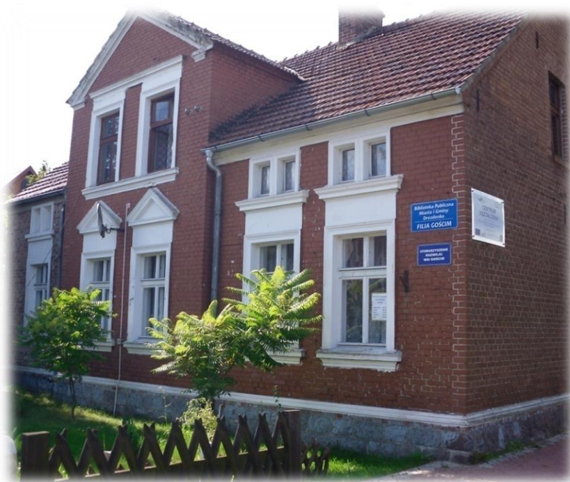
biblioteka w Gościmiu