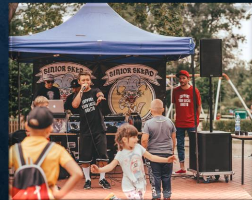
Patryk foto lens