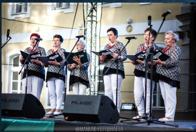
Stokrotki – zespół z Trzebicza