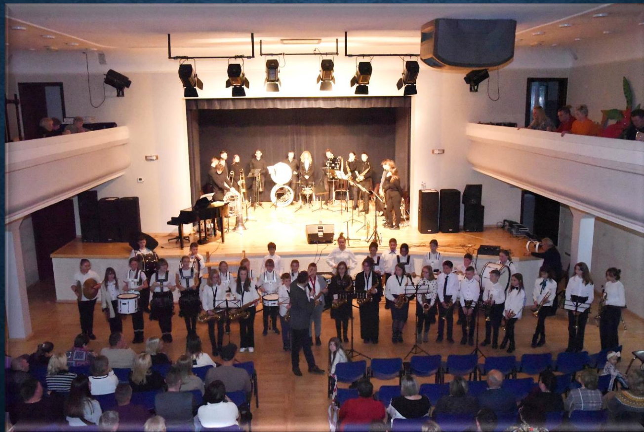
ORKIESTRA DĘTA CPK