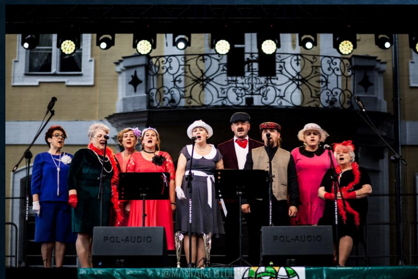
Macierzanka z Gościmia