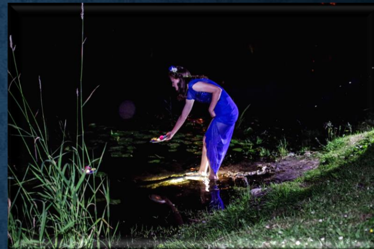
Zespół Taneczny "Paradise" CPK