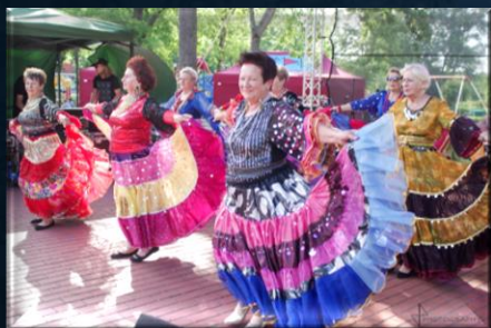
Zespół Taneczny "Pasjonata"