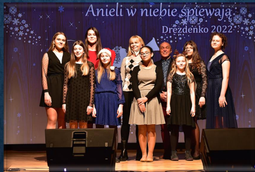
Studio piosenki Happy Voice