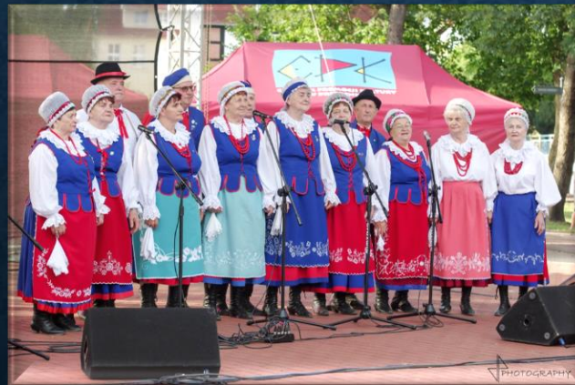
Zespół Kujawy Bachorne Nowe