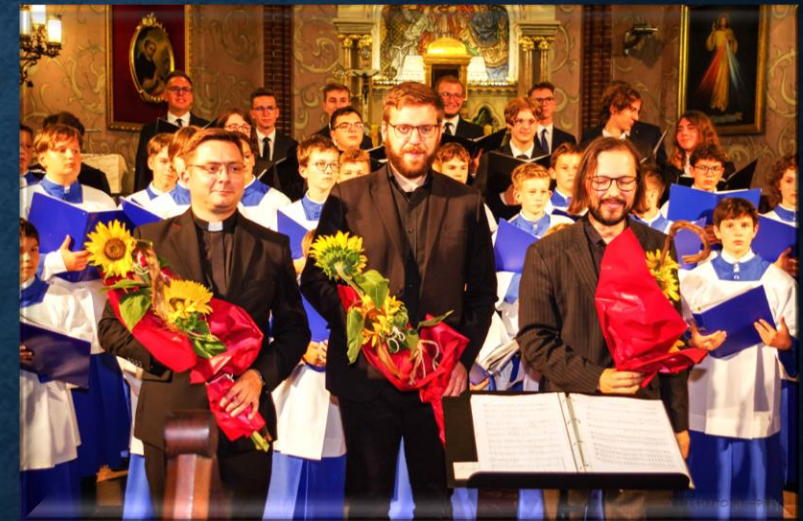
• CHŁOPIĘCO – MĘSKI POZNAŃSKI CHÓR KATEDRALNY