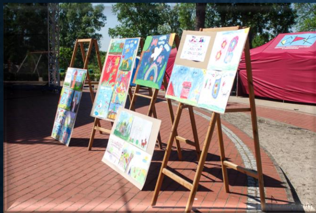
Wręczenie nagród podczas Nocy Świętojańskiej