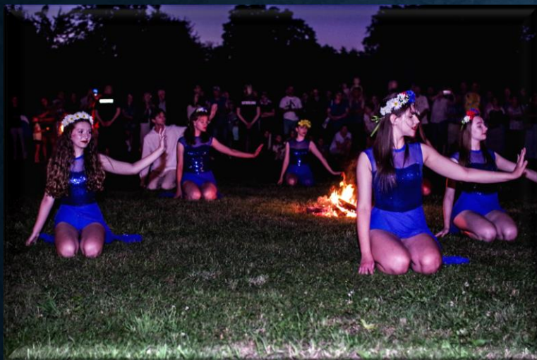
Zespół "Macierzanka" z Gościmia