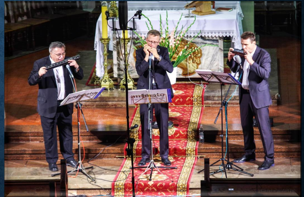
• TRIO ANIMATO – TRIO HARMONIEK USTNYCH